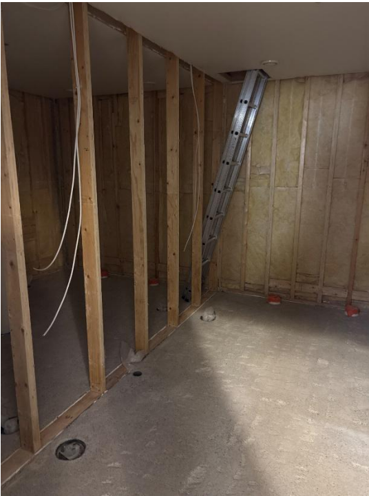
129/130 wc tilojen sähkötyöt edenneet, väliseinäurakoitsija aloittaa työt 29.6 → Electrical works in the WC facilities (Rooms 129/130) are progressing as planned. The partition wall contractor is scheduled to commence work on 29 June