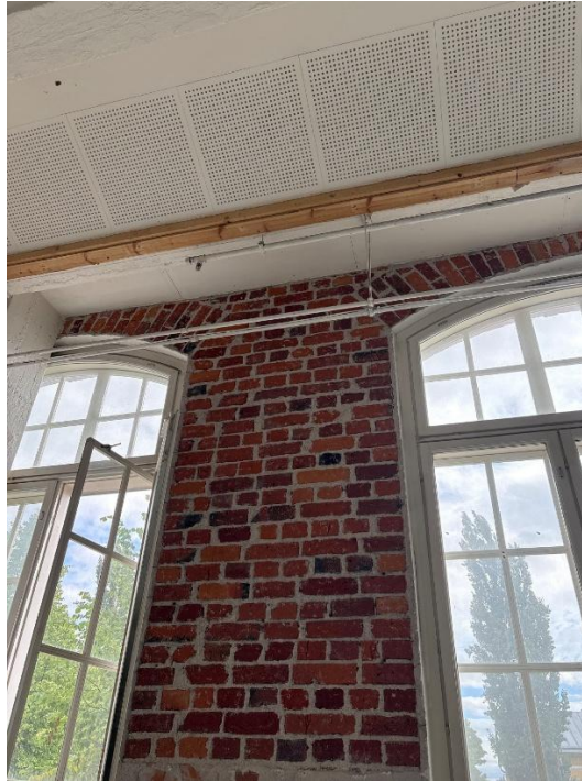
126 tilan tiilipinnan esiinottaminen → Exposure of the brickwork in Room 126